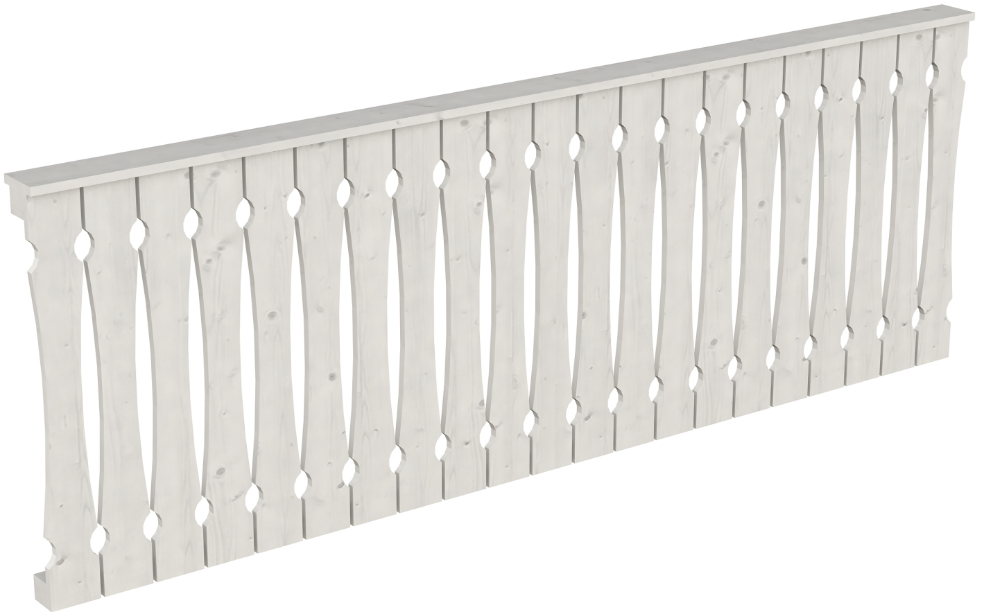
Produktbild AK-Brüstung 270cm