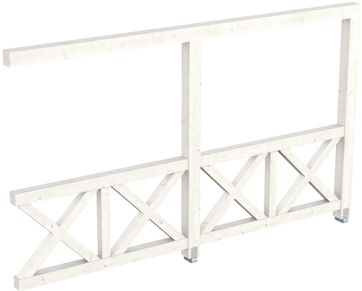
Produktbild AK-Seitenwand 355cm