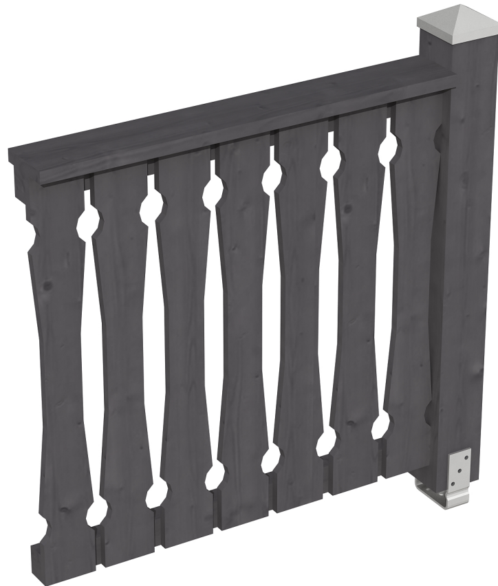
Produktbild Brüstung 108 cm