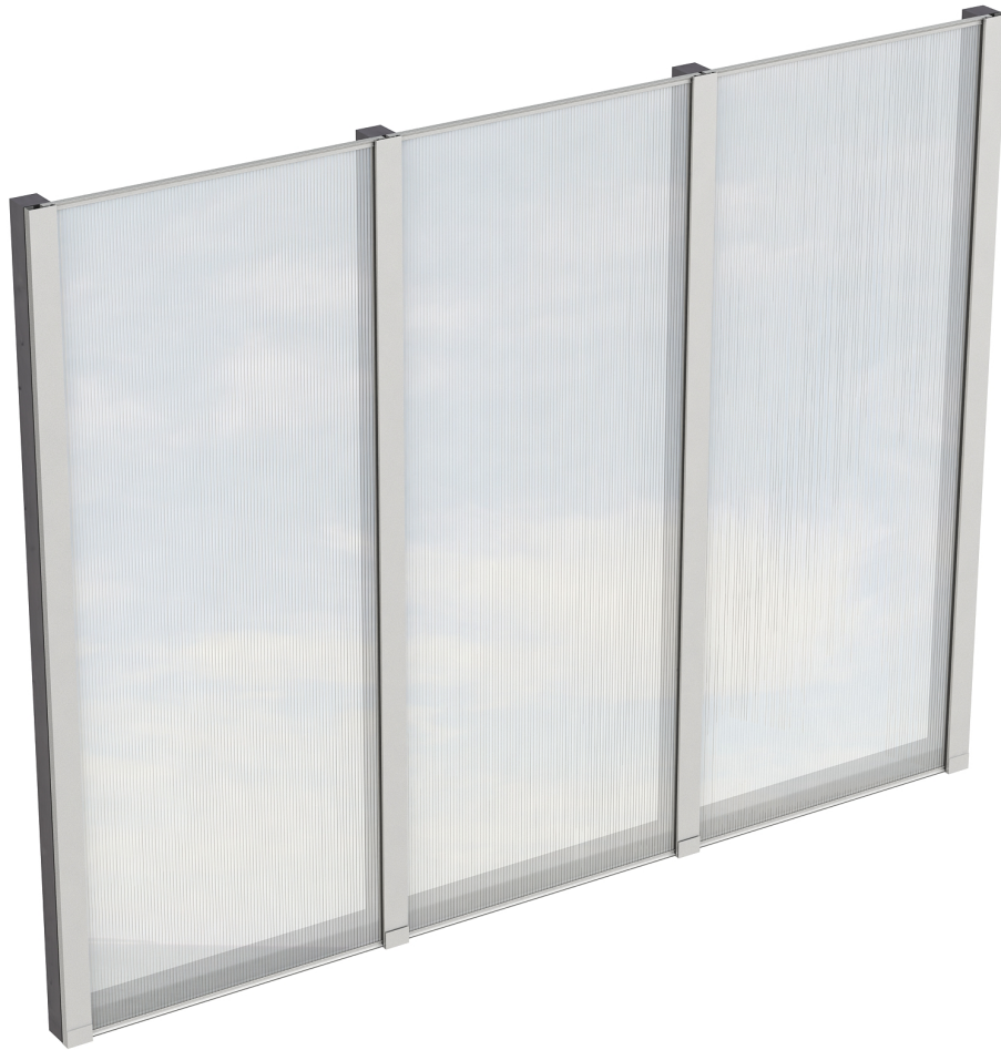
Produktbild Polycarbonat-Seitenwand 255cm