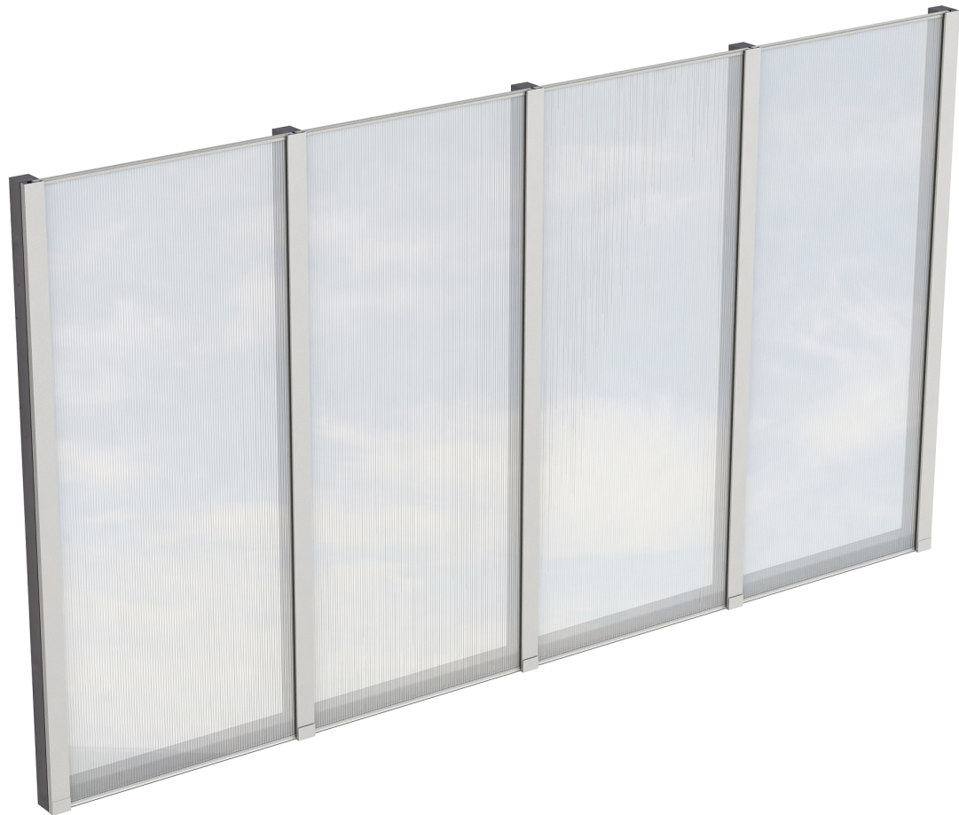
Produktbild Polycarbonat-Seitenwand 355cm