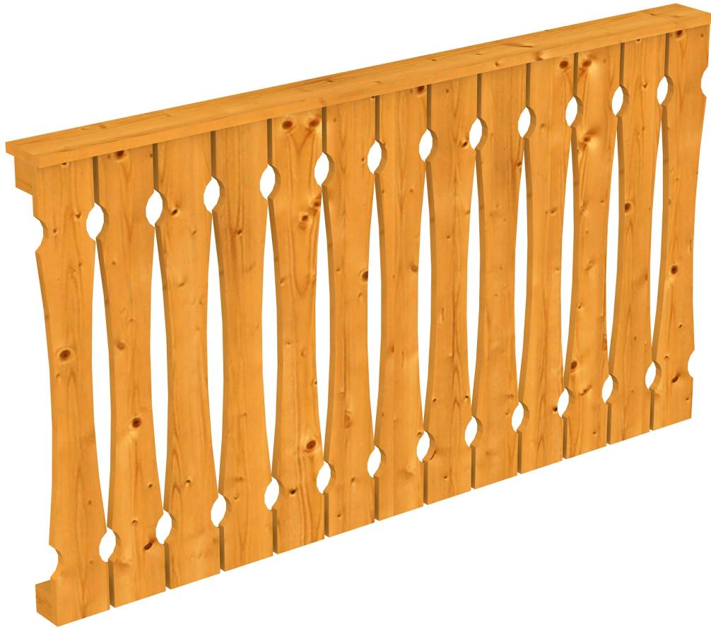
Produktbild AK-Brüstung 170cm