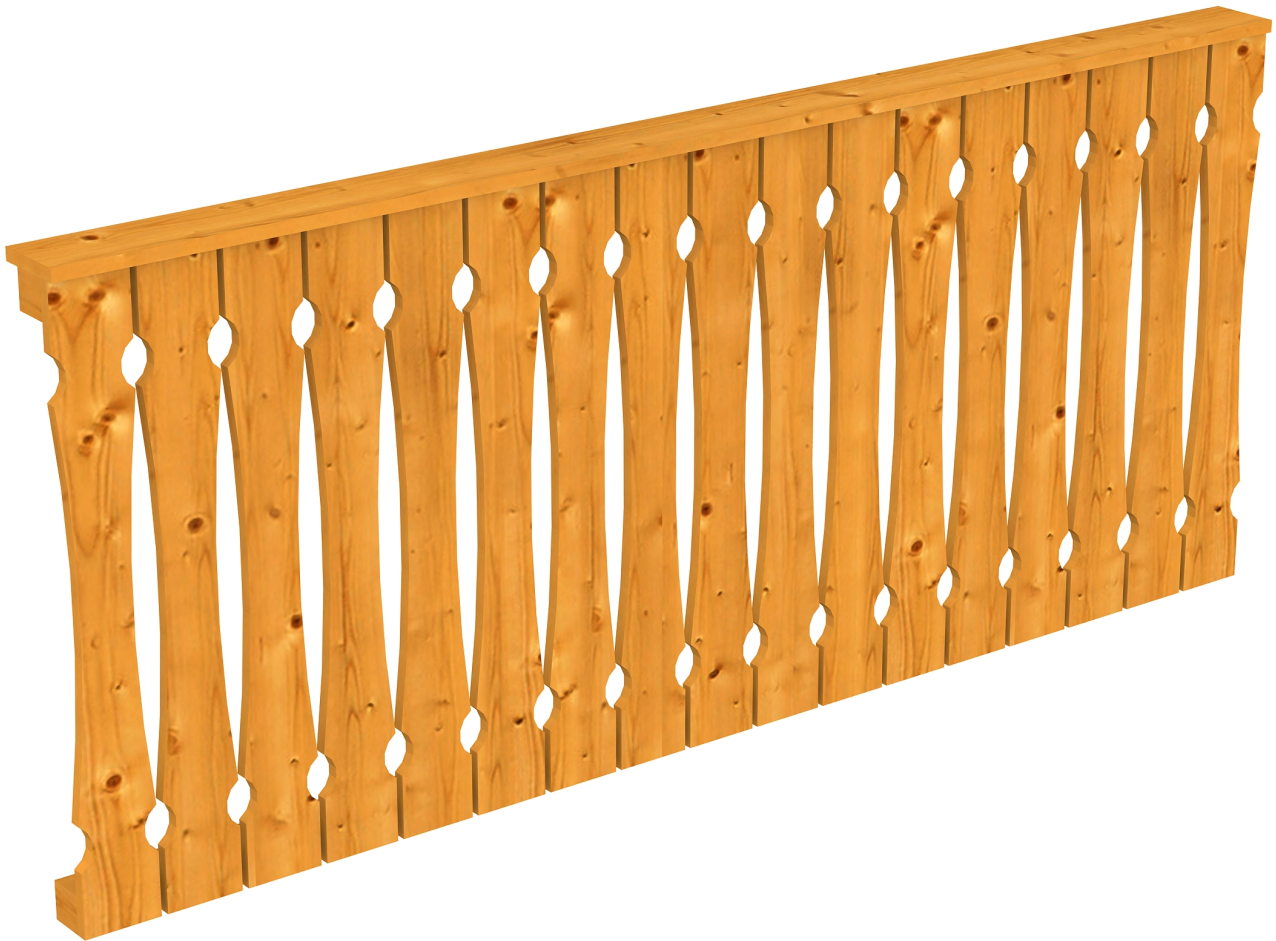
Produktbild AK-Brüstung 220cm