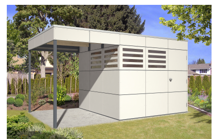
Seitliche Überdachung mit Haus