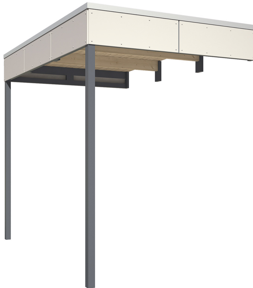
Produktbild Seitliche Überdachung