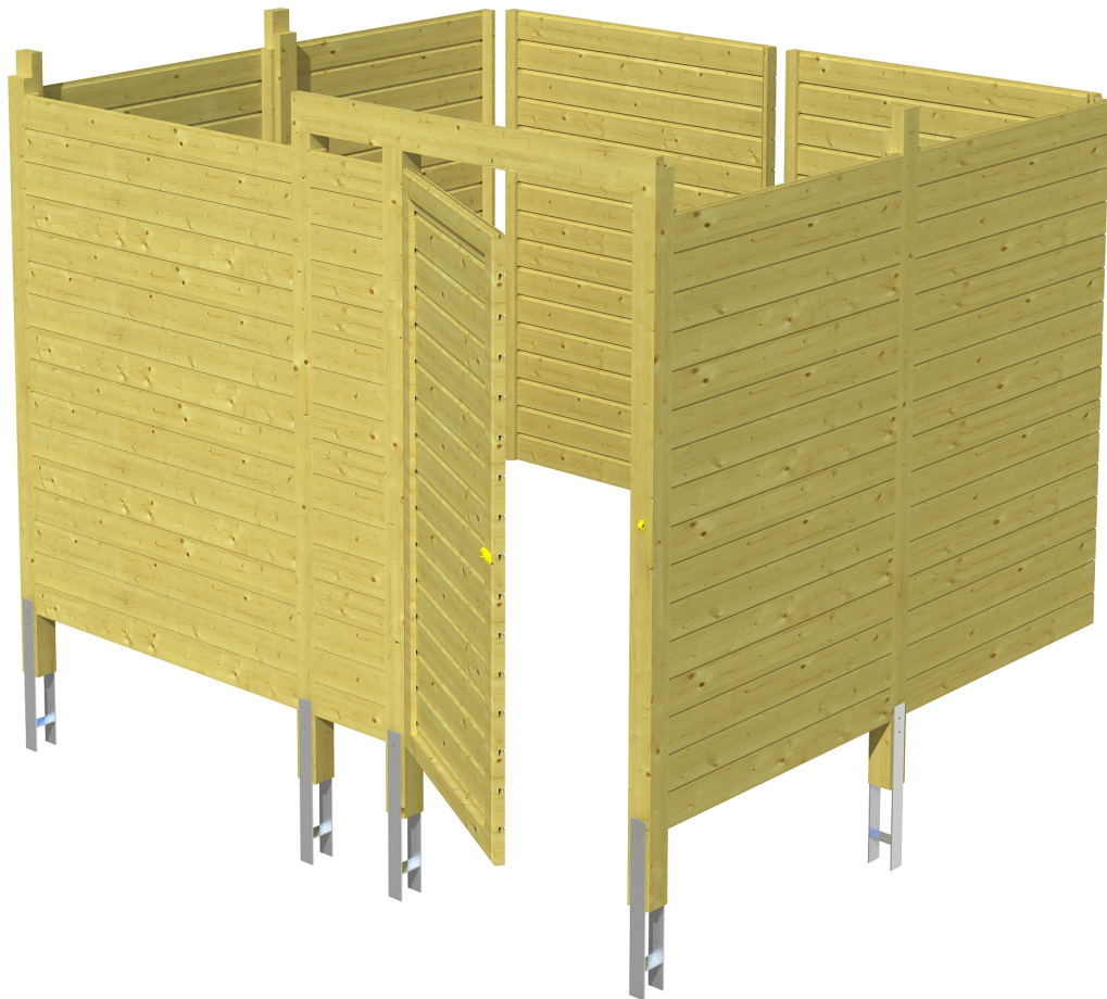
Produktbild Abstellraum C8