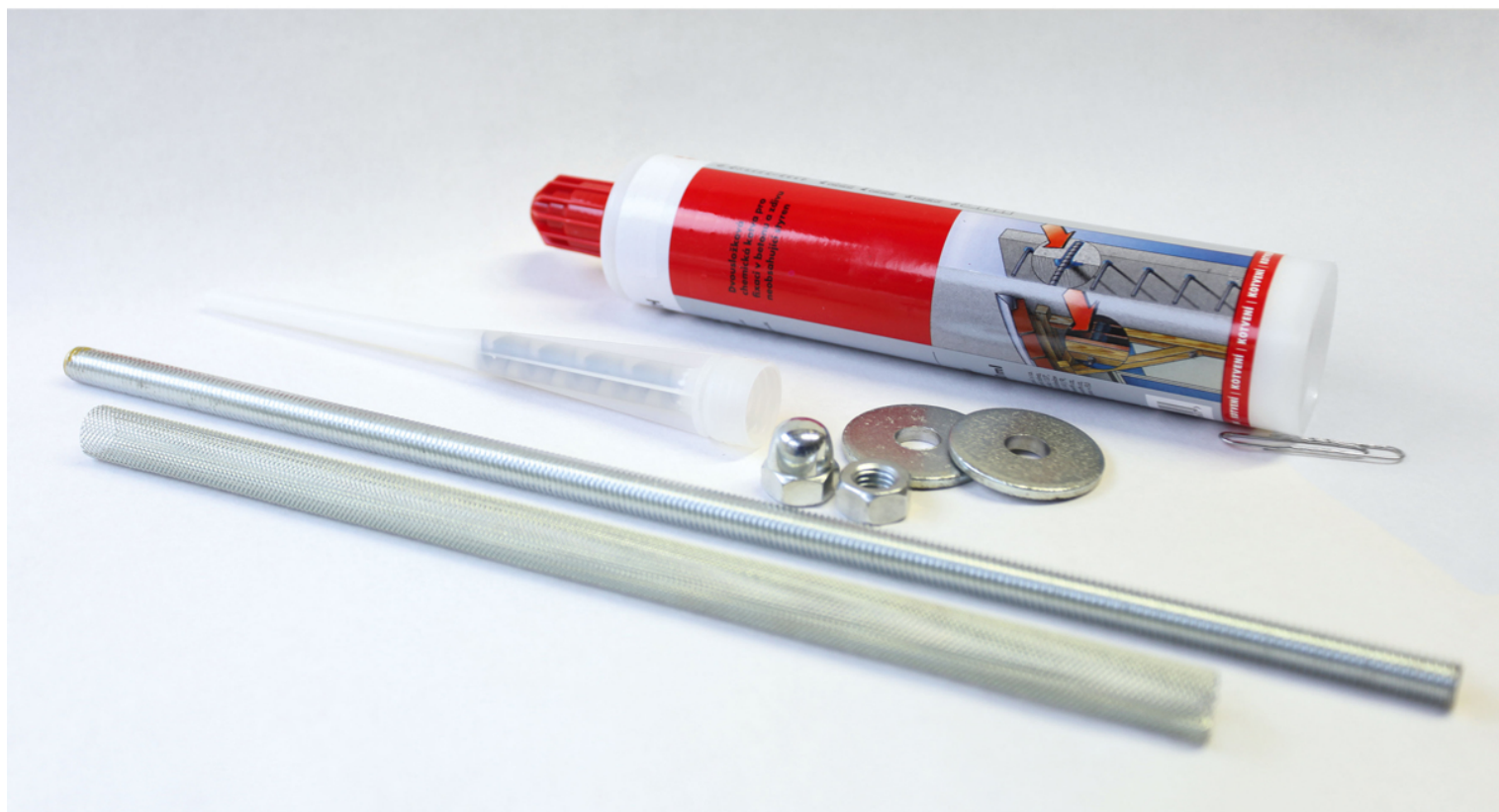
Materialien vom Wandbefestigungsset