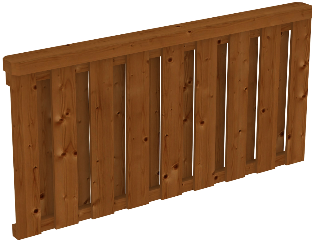
Produktbild Brüstung Deckelschlung 170cm