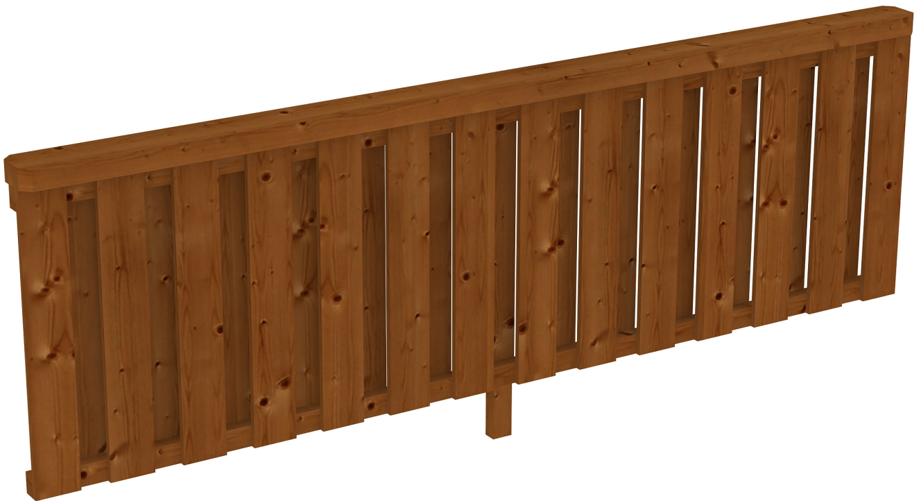
Produktbild Brüstung Deckelschlung 270cm