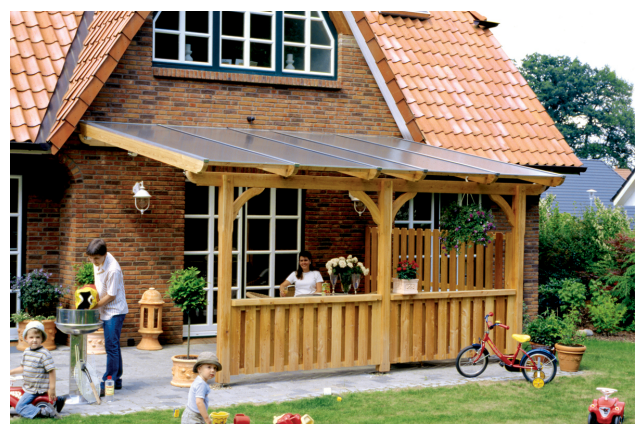
Kundenfoto: Terrassenüberdachung mit Brüstungen und Seitenwand