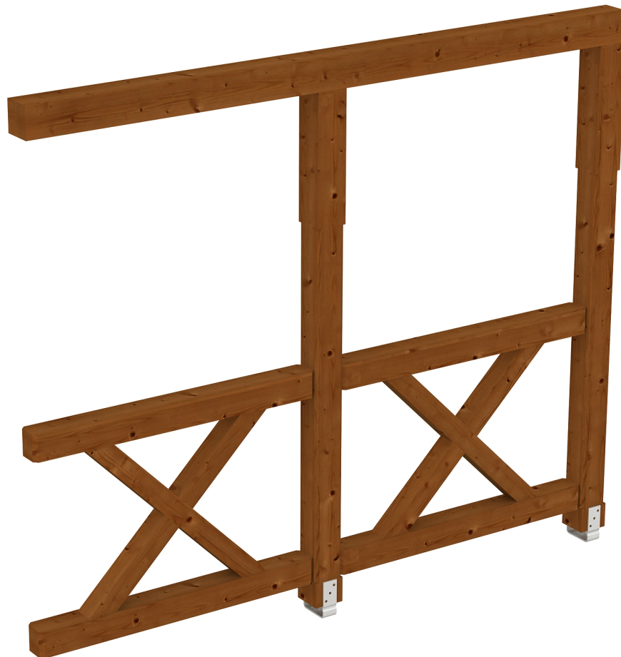
Produktbild AK-Seitenwand 255cm