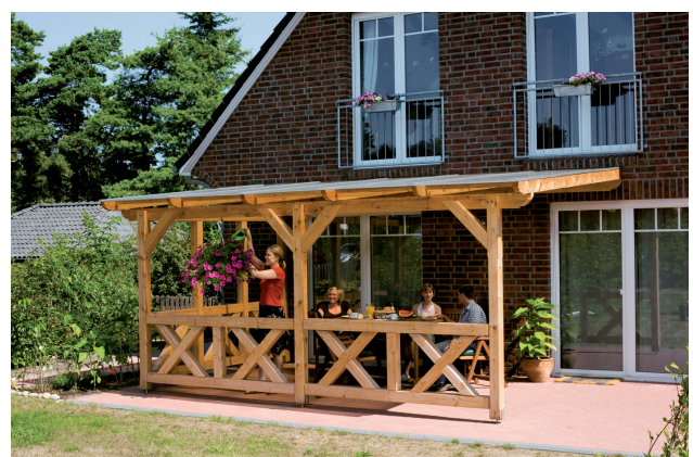
Kundenfoto: Terrassenüberdachung mit Brüstungen und Seitenwand