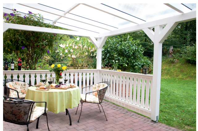
Kundenfoto: Terrassenüberdachung in weiss mit Brüstungen