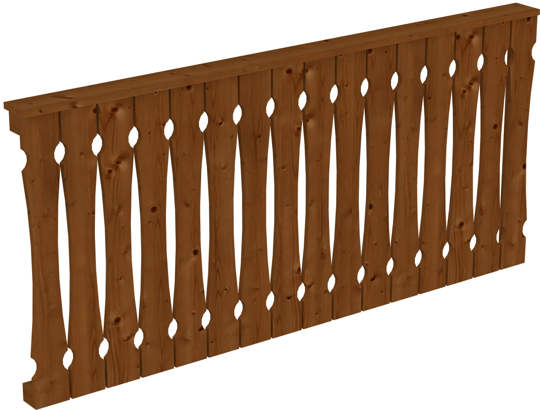
Produktbild AK-Seitenwand 205cm