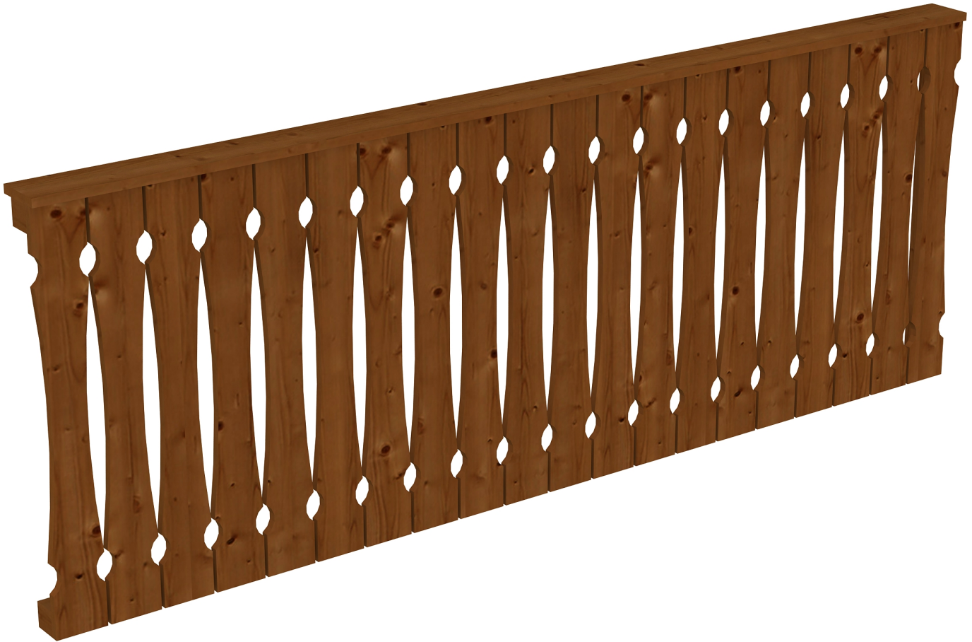
Produktbild AK-Seitenwand 255cm