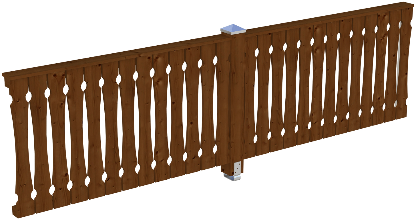
Produktbild AK-Seitenwand 355cm