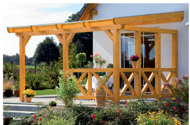
Kundenfoto: Terrassenüberdachung mit einer Brüstung und Seitenwand