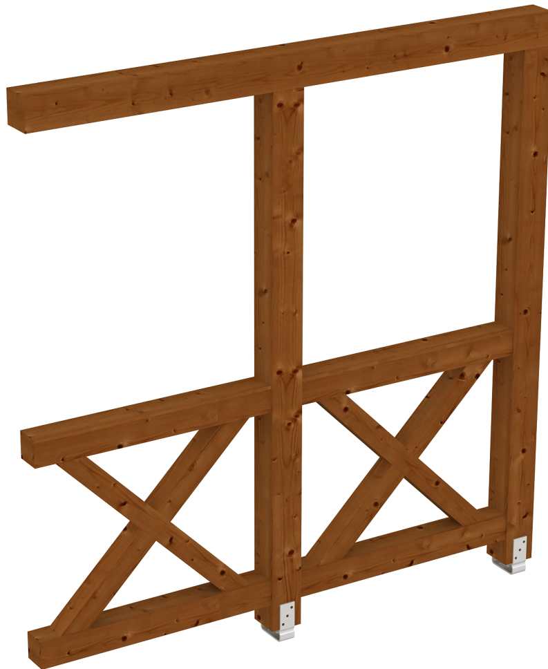
Produktbild AK-Seitenwand 205cm