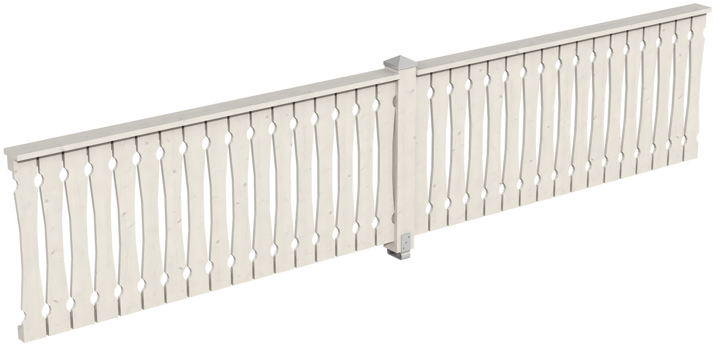
Produktbild Brüstung 465 cm