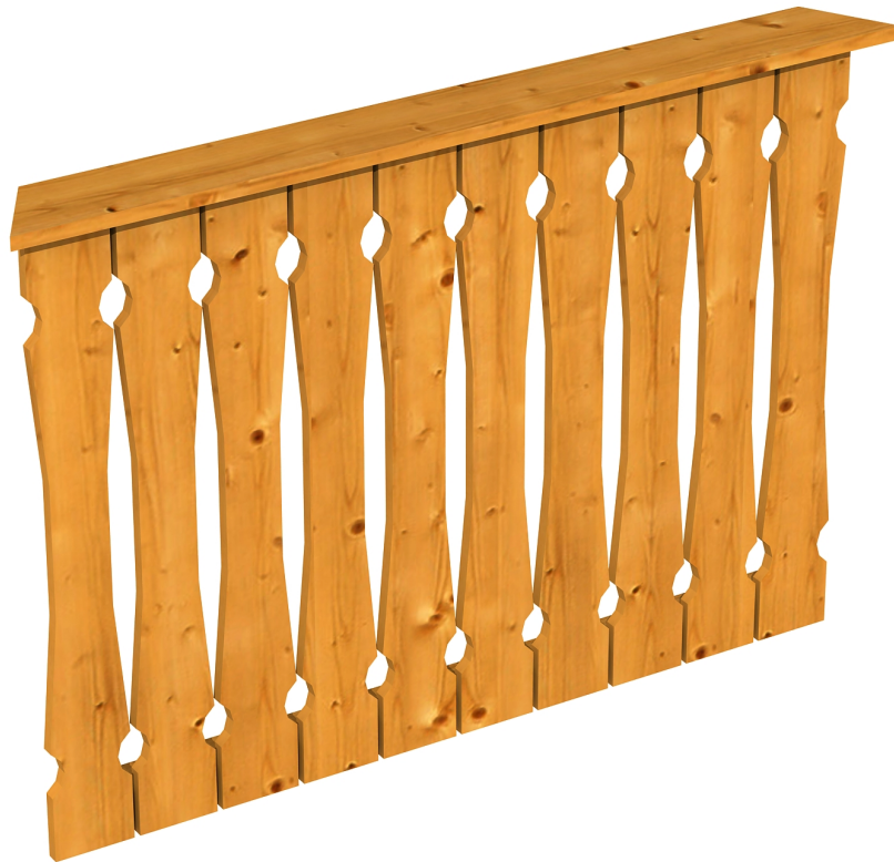
Produktbild Brüstung 120 cm