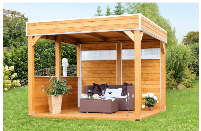
Kundenfoto: Pavillon mit Zubehör