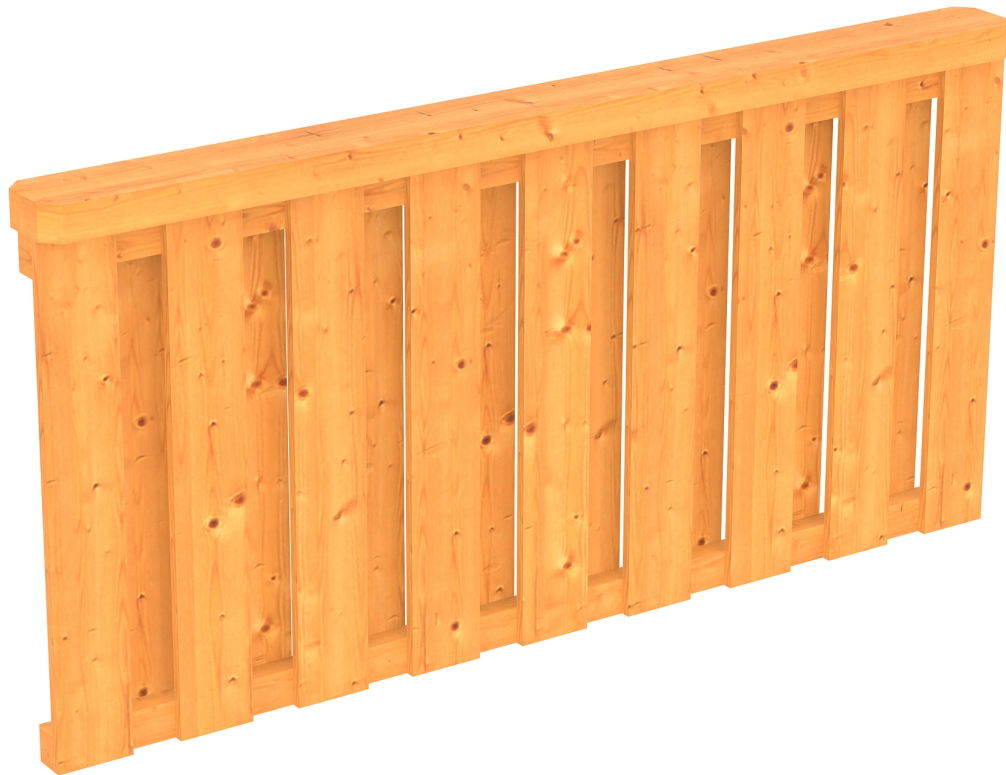
Produktbild Brüstung Deckelschlung 170cm