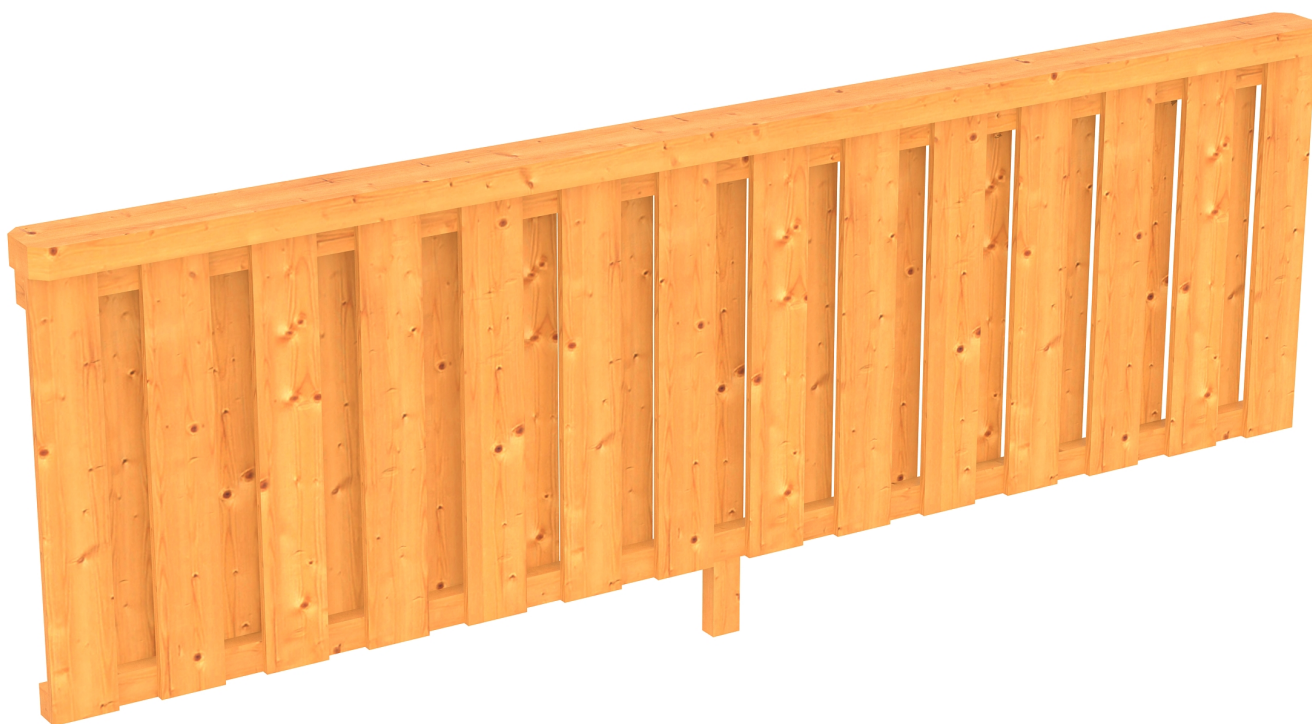
Produktbild Brüstung Deckelschlung 270cm