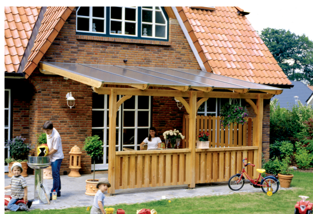
Kundenfoto: Terrassenüberdachung mit Brüstungen und Seitenwand