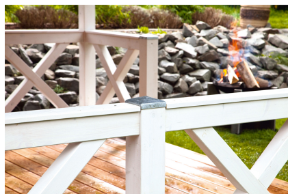
Kundenfoto: Andreaskreuz in weiss