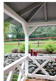
Kundenfoto: Andreaskreuz in weiss