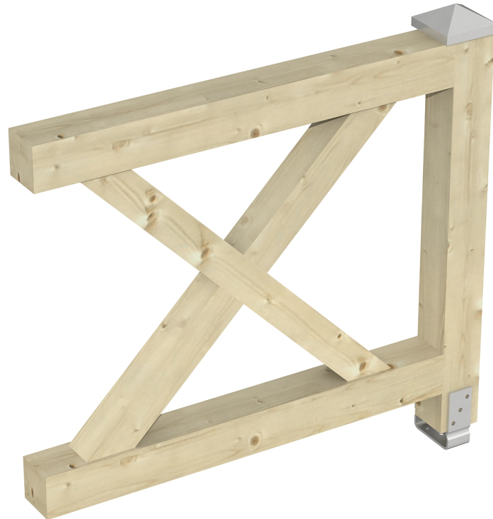
Produktbild AK-Brüstung 108cm