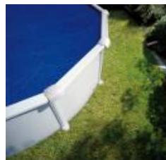
Cubierta isotérmica Isothermic cover CPROV915