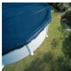
Cubierta de invierno Winter cover CIPROV911