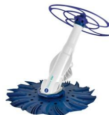
Limpiafondos automático Automatic cleaners 90397