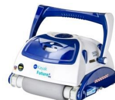
Robot Robot RKFA100