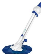
Limpiafondos automático Automatic cleans 19001