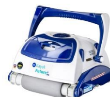
Robot Robot RKFA100