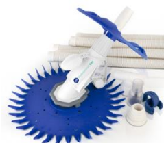
Limpiafondos automático Automatic cleaner 19007