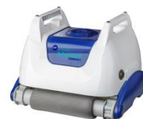
Robot Robot RKA80