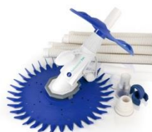
Limpiafondos automático Automatic cleaner 19007