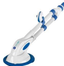
Limpiafondos automático Automatic cleaner 90399