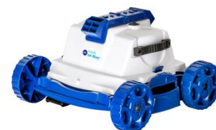
Robot Robot RKJ14