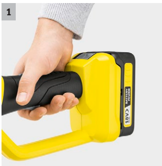
1 18 V Kärcher Battery Power-Akkuplattform