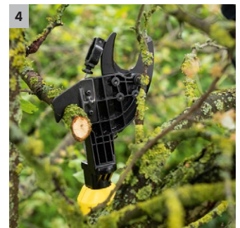
4 Fixierbarer Haken