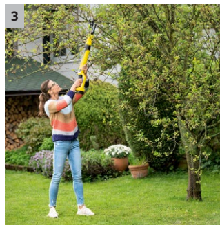
3 Hohe Reichweite