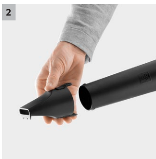
2 Abnehmbare Flachdüse