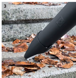
3 Integrierte Kratzkante