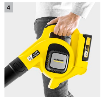
4 Ergonomisches Design