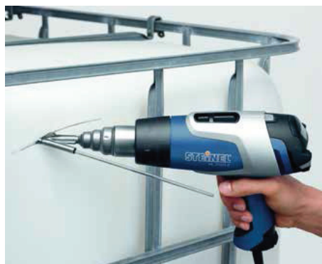
Reparieren. PVC-Wassertank schweißen.