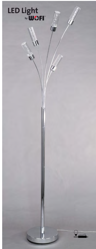
© WOFI LEUCHTEN Wortmann & Filz GmbH . Im Langel 6 . D-59872 Meschede