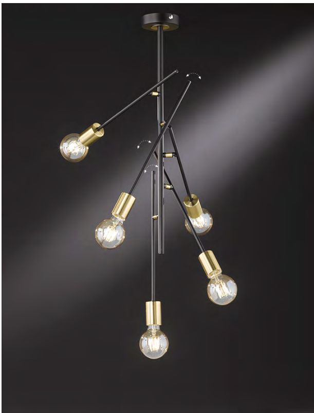
Wortmann & Filz GmbH · Im Langel 6 · 59872 Meschede-Freienohl Phone +49 (0) 29 03 / 449-0 · Fax +49 (0) 449-114 · www.wofi.de · info@wofi.de