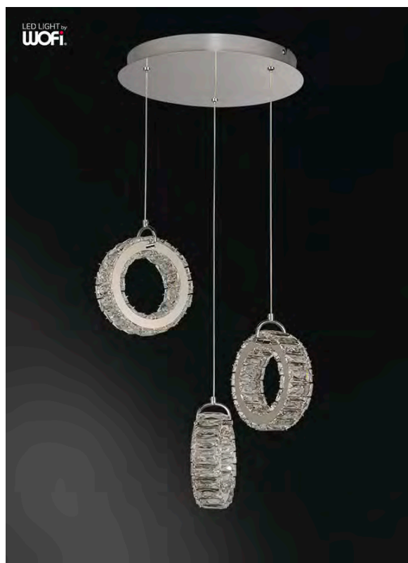
Wortmann & Filz GmbH · Im Langel 6 · 59872 Meschede-Freienohl Phone +49 (0) 29 03 / 449-0 · Fax +49 (0) 449-114 · www.wofi.de · info@wofi.de