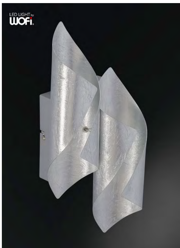
Wortmann & Filz GmbH · Im Langel 6 · 59872 Meschede-Freienohl Phone +49 (0) 29 03 / 449-0 · Fax +49 (0) 449-114 · www.wofi.de · info@wofi.de