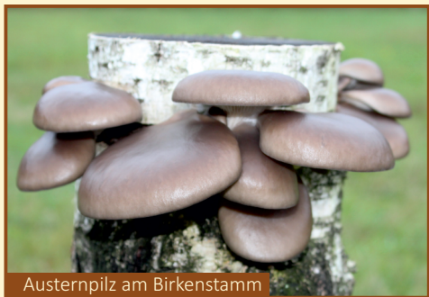
Austernpilz am Birkenstamm